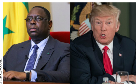
La bourde de TRUMP vue du WEB P.4