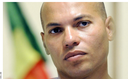
Une nouvelle polémique au- tour de Karim WADE P.11