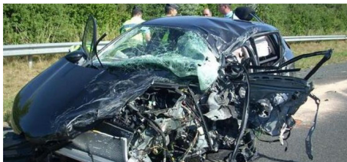
Coupable mais peut-être pas responsable ! P.5